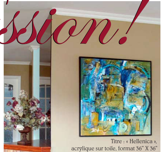
Titre : « Hellenica », acrylique sur toile, format 36" X 36" Salon résidentiel.