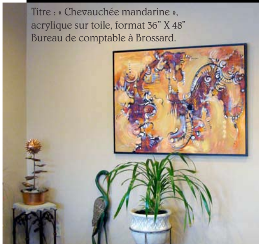
Titre : « Chevauchée mandarine », acrylique sur toile, format 36" X 48" Bureau de comptable à Brossard.