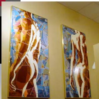
Titre : « XX et XY », dyptique acrylique sur toile, format 60" X 30". Clinique chiropratique de la Gare à Saint-Basile-le-Grand.