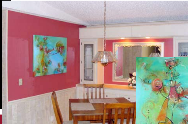
Titre : « Appyakidou », acrylique et collage sur toile, format 30" X 40", Salle à dîner.

Création authentique, réalisation unique !